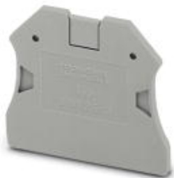
Tapa final, longitud: 47 mm, anchura: 2,2 mm, altura: 39,8 mm, color: gris

Tenga en cuenta que los datos indicados aquí proceden del catálogo en línea. Los datos completos se encuentran en la documentación del usuario. Son válidas las condiciones generales de uso de las descargas por Internet. ( http://phoenixcontact.es/download )