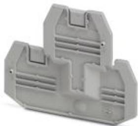
Tapa final, longitud: 69,9 mm, anchura: 2,2 mm, altura: 57,5 mm, color: gris

Tenga en cuenta que los datos indicados aquí proceden del catálogo en línea. Los datos completos se encuentran en la documentación del usuario. Son válidas las condiciones generales de uso de las descargas por Internet. ( http://phoenixcontact.es/download )