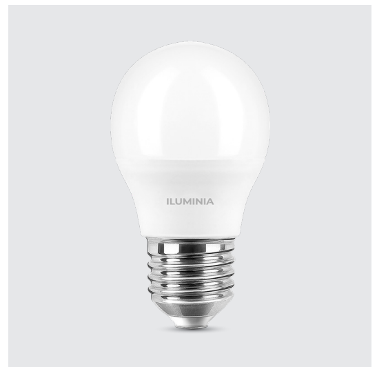
Imagen / Image